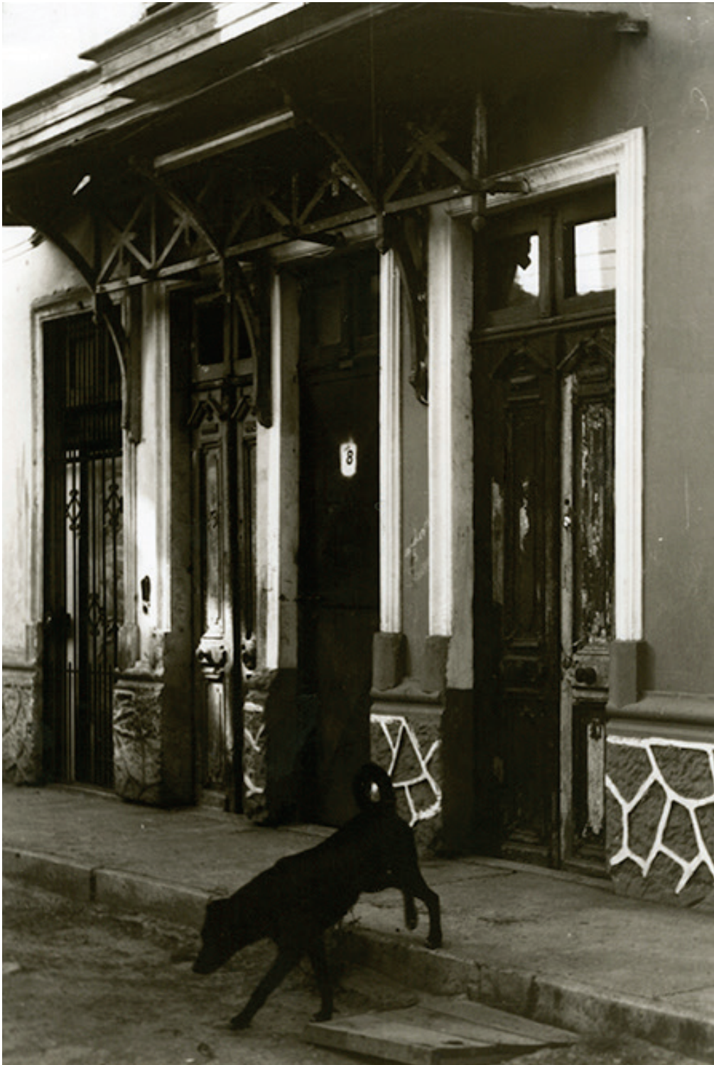
Fotografías de la serie Vida Urbana, 2004